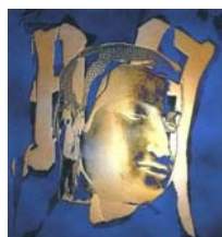
Reiki-Lotus is een Reiki- en meditatiepraktijk die werkt vanuit een Boeddhistische

Onafhankelijk van welke theorie gebruikt wordt kan Shiva Shakti opwekken en andersom. Afhankelijk van je eigen voorkeur kan je dus middels Reiki, Yoga en meditatie Shiva opwekken door aandacht te geven aan je Kruin-Chakra of Shakti opwekken door aandacht te geven aan je Sacraal Chakra, of de samenkomst op te wekken door aandacht te geven aan je Zonnevlecht. Meerdere oefeningen zijn mogelijk.